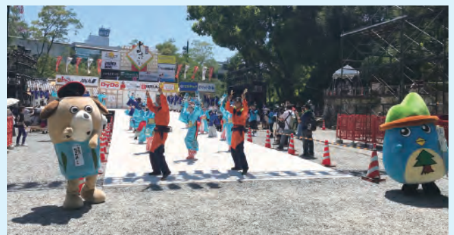
林業の活性化をめざして（よさこい祭り・めぐみ）

答 【林業振興・環境部長】 平成31年度は市町村約5億7,000万円、県約1億4,000万円。その後段階的に増額され、平成45年度以降は市町村約19億円、県約2億円となる見込み。適切な森林整備が行われ、中山間地域における雇用の確保、活性化につながることを期待される。