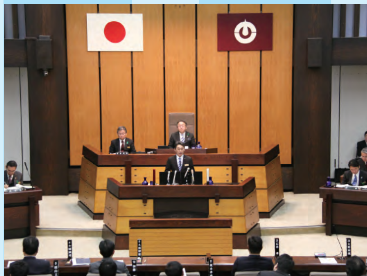
平成30年2月議会本会議 一般質問