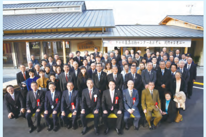
とかの集落活動センター あおぞら開所式

答 【中山間振興・交通部長】中山間地域集落の買い物弱者対策は切実で、課題解決のため集落活動センターによる取り組みは有効な方策と考える。市町村となお一層の連携を図りながら積極的に支援してまいります。