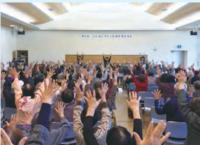
ふれあいサロン百歳体操交流会

答 【林業振興・環境部長】新たな処分場に持ち込まれる廃棄物は、鉱滓や石こうボード、燃え殻などで、法令により有害物は持ち込めない。粉じんが外部に飛散することはなく、水は施設外に放流されない。建設予定地の地形や地質等に応じて、万全の耐震対策を講じるなど、県民の皆様にご安心していただくことができる安全な施設として整備してまいります。