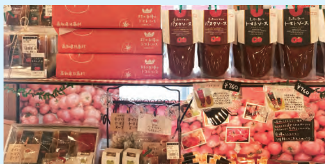
人気のトマト加工品（村の駅ひだか）

全雇用状況下における持続的な拡大再生産の創出に向け、成長の壁を乗り越える、成長に向けたメインエンジンをさらに強化する施策群を大幅に強化してまいります。